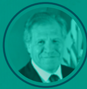
Luis Almagro Secretario General